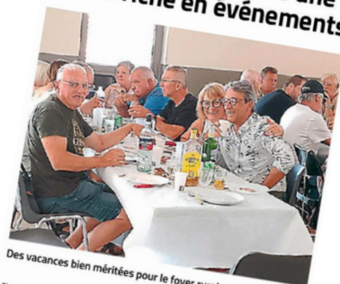
Des vacances bien méritées pour le foyer rural.

Le foyer rural termine une année riche en événements