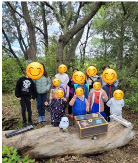
Chasse au trésor Harry Potter Au Pech Bellonet