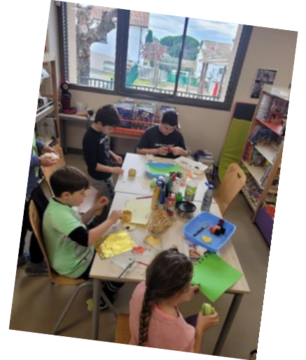
Fête des Pères