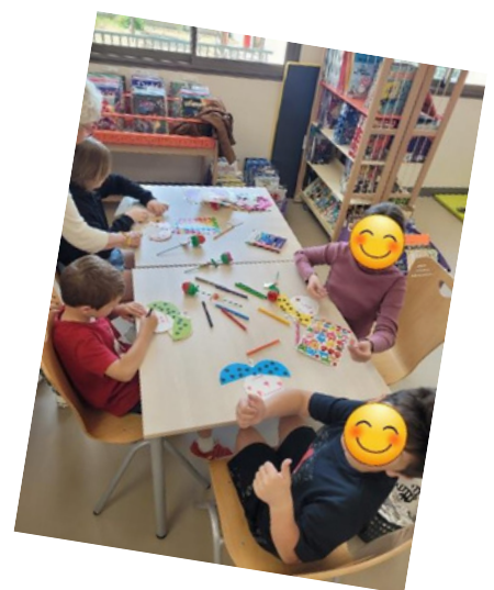
Fête des Mères