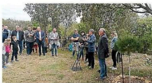
Le maire a remercié les habitants d'être venus en nombre.

C'est par une météo clémente qu'a eu lieu samedi dernier l'inauguration du pech Bellonet, petite colline de deux hectares située au nord-ouest de Coulobres. Le rendez-vous était prévu à 11 h et c'est presque une centaine de personnes qui se sont présentées sur le lieu de départ d'une visite de l'ensemble de l'aménagement. C'est l'Office national des forêts (ONF) qui a assuré les gros œuvres d'élagage, de la mise en place du mobilier en bois, tables de pique-nique, bancs et belvédère. Un