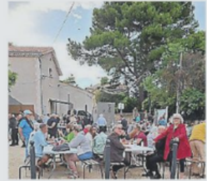
Une température idéale partagée par les convives.

Pari réussi pour cette troisième édition des soirées divines organisée par la mairie. C'est plus d'une centaine de personnes qui au fil de la soirée ont occupé les tables et bancs mis en place sur le boulodrome. Trois domaines locaux présentaient leurs cuvées aux dégustateurs : les caves Molière, les domaines Mi-côte et la Limbarrière. Côté gastronomie Pizza del Tony, the Dinette d'Espoudeuilhan et les coquillages de Perea ont régalé les convives. Les plus tardifs ont profité de la très belle prestation